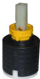
Kludi Mx, Objekta Mix